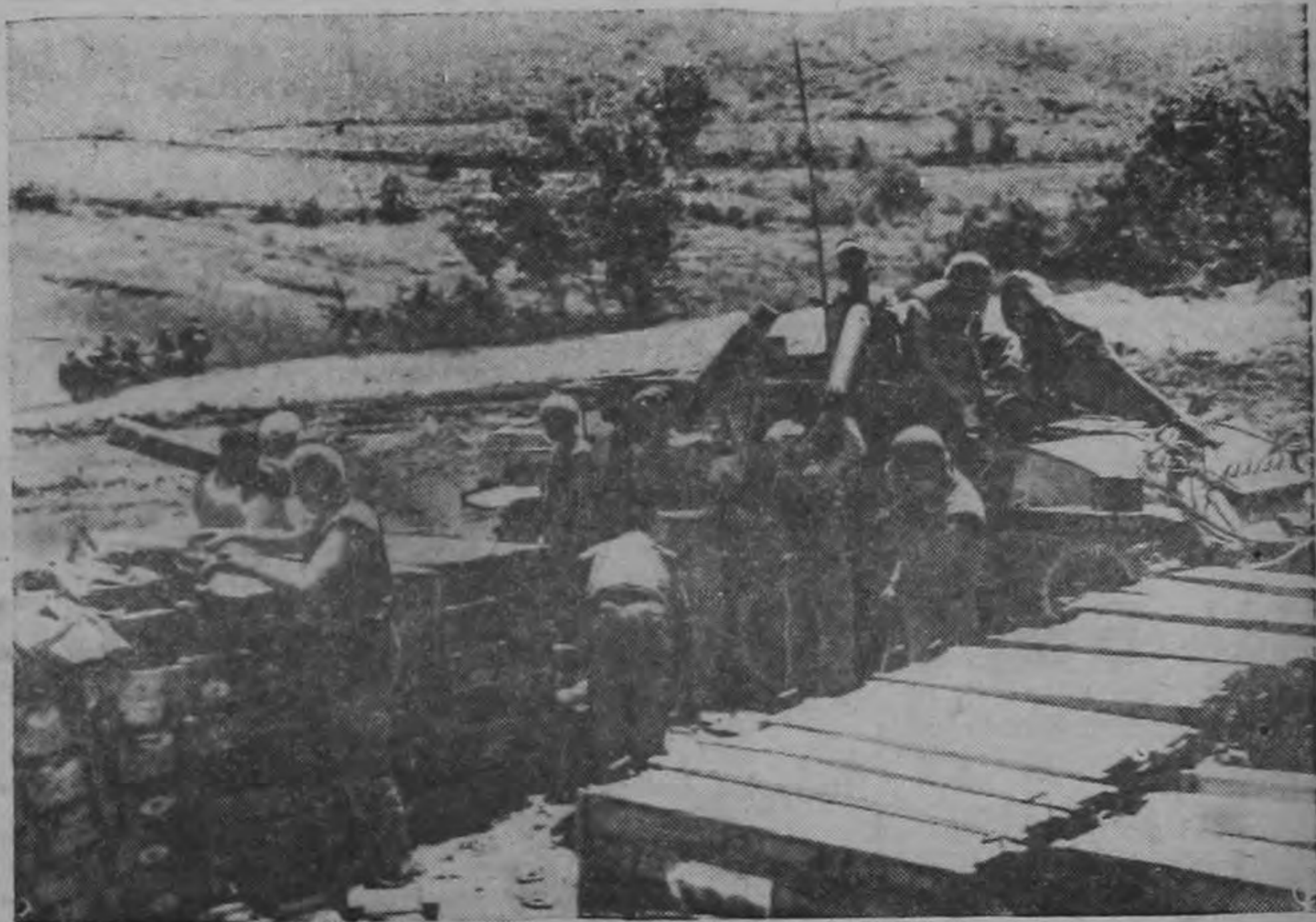
¿GUERRA O PAZ?—Esta es una de las últimas vistas tomadas en los frentes de combate de Corea. La fotografía fué transmitida por radio (Radiophoto) y recibida en Nueva York el 3 de junio por el servicio de INP. Muestra como, hasta el último instante, en previsión de una celada roja, las Naciones Unidas han seguido empeñadas en resolver los problemas de la guerra. En este caso se trata del perfeccionamiento del sistema de transporte de municiones. Hay probabilidades de que sea, la que presentamos, una de las escenas finales del conflicto, porque hasta la madrugada de hoy se estaba esperando la definitiva concertación de un armisticio, preludio de la paz.