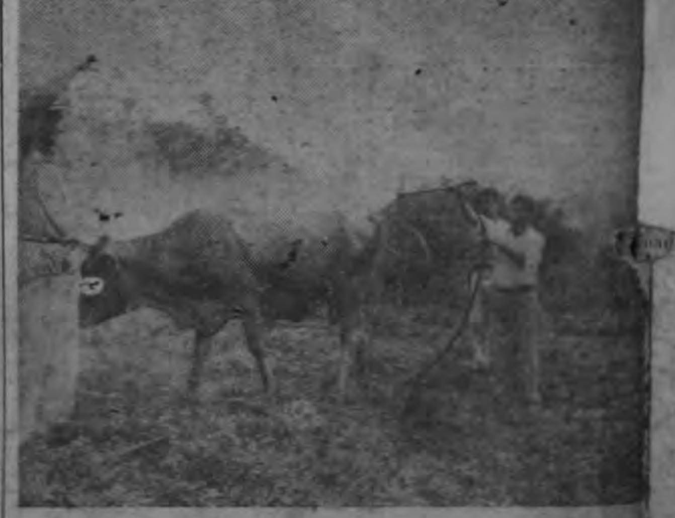
Un miembro de una de las cuadrillas destacadas en San Carlos aplica a una res el insecticida Toxaphene por medio de una atomizadora.